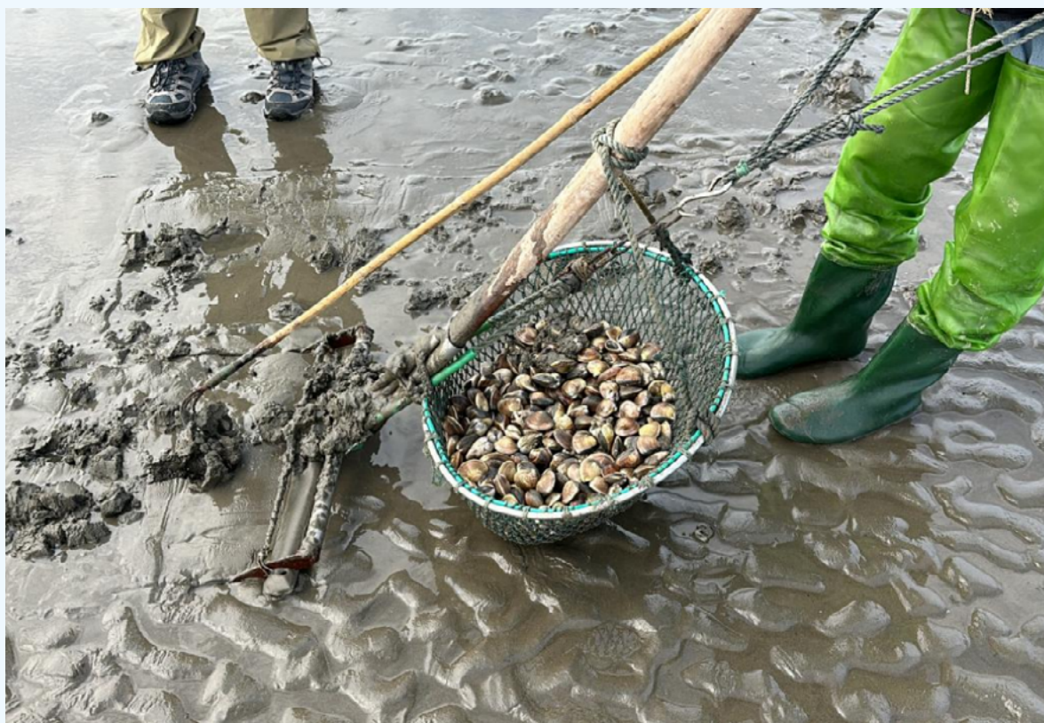
江苏如东滨海村滩涂上的成蛤人工采收