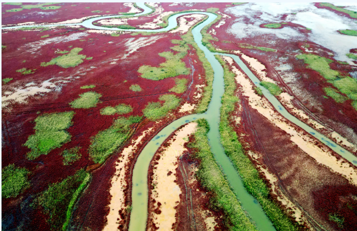
山东东营滨海湿地