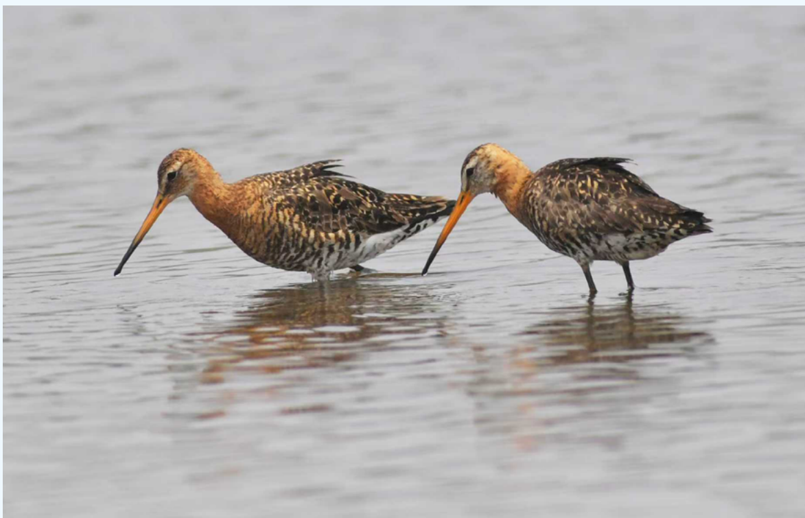
两只正在觅食的黑尾塍鹬