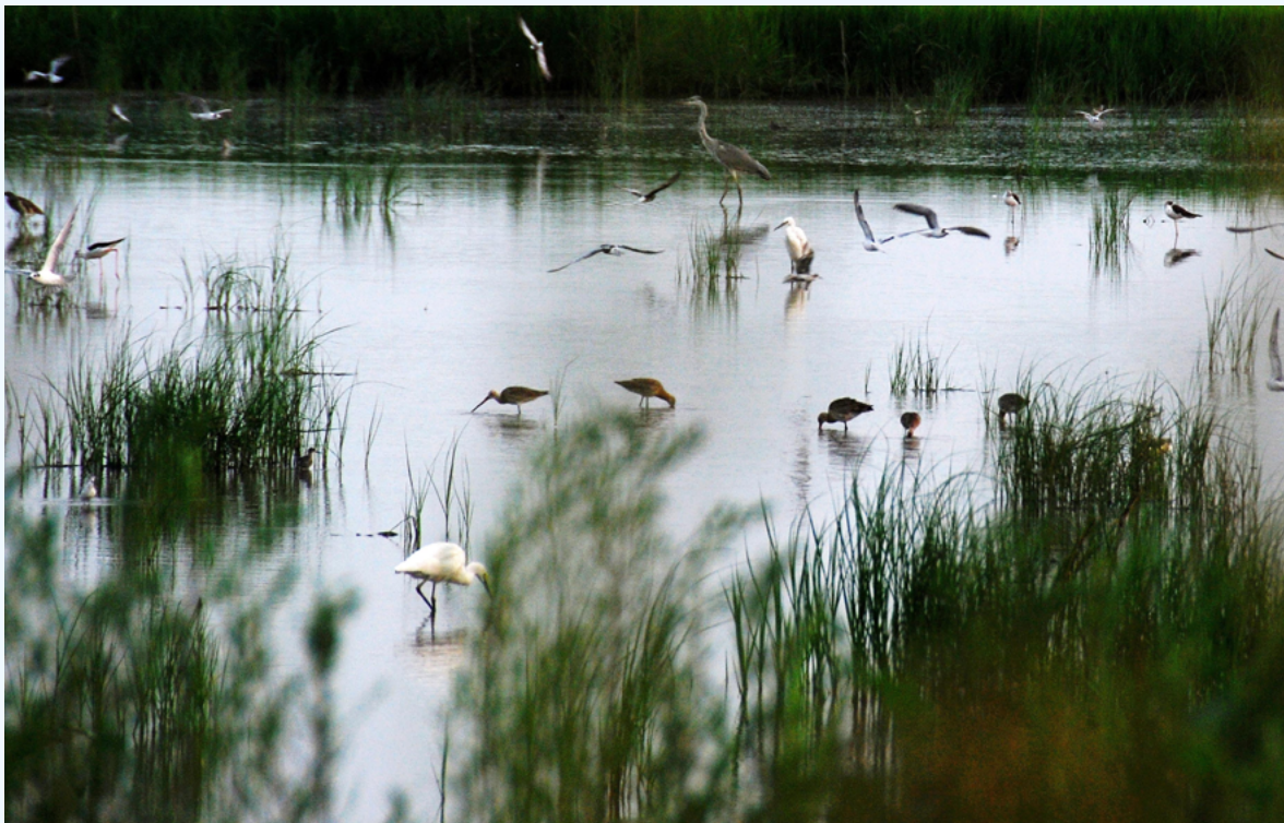
曹妃甸湿地的鸟类